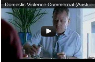
Domestic Violence Commercial (Australia)

Nemokamos teisinės ir psichologinės konsultacijos moterims!